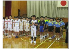
選手代表あいさつ

だけでは学ぶことが出来ない 貴重な学び をしてきました。「悔いを残さない、後悔しない」大会となることを願っています。あわせて、部活動に取り組めたのは、家族の協力があったからです。「 ひたむきさ 」「 さわやかさ 」「 はつらつさ 」「 いさぎよさ 」のある姿で感謝の気持ちを伝えて欲しいと願っています。