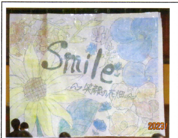
令和5年度玲瓏祭「ビッグアート」

古殿中学校玲瓏祭で全校生が取り組む内容の1つに「ビッグアート」があります。全校生から原画を募集し、デザインを決定します。それをもとに、生徒一人一人が用紙に印刷されている枠に指定された色のシールをはっていきます。それを組み合わせると1つのデザインが完成します。生徒は、自分が作業している用紙がどんなデザインの一部になるかわかりません。生徒は、玲瓏祭当日完成したデザインを見るのを楽しみにしています。